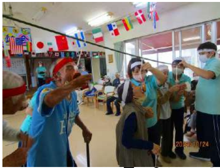
『パクツと丸ぼうろ』