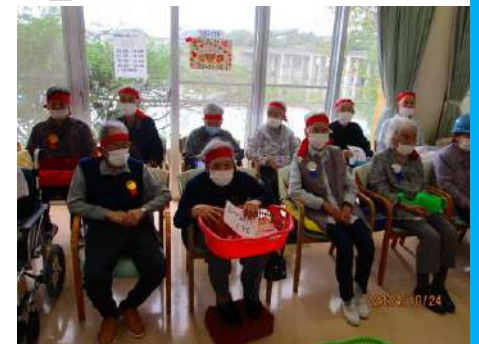
『借り物運試し競争』